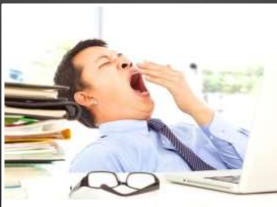
¿Qué está haciendo?