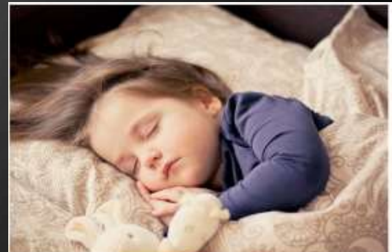
¿Qué está haciendo el niño?