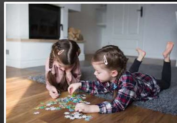
¿Qué están haciendo?