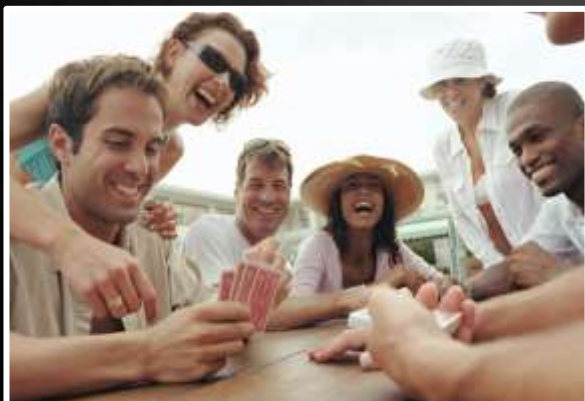
¿Qué están haciendo?