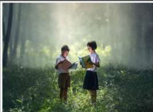
¿Qué están haciendo?