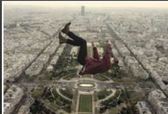
¿Qué está pasando?