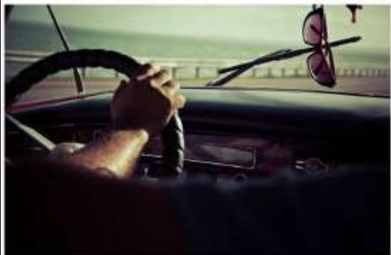
¿Qué está haciendo?