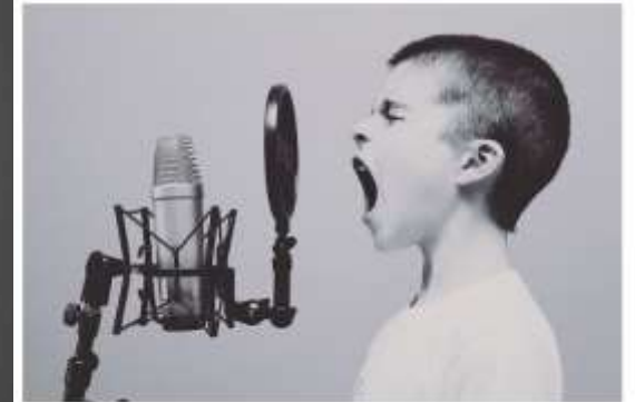
¿Qué está haciendo el niño?