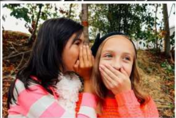
¿Qué está haciendo la niña con el pelo moreno?