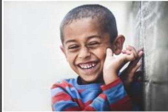
¿Qué está haciendo el niño?