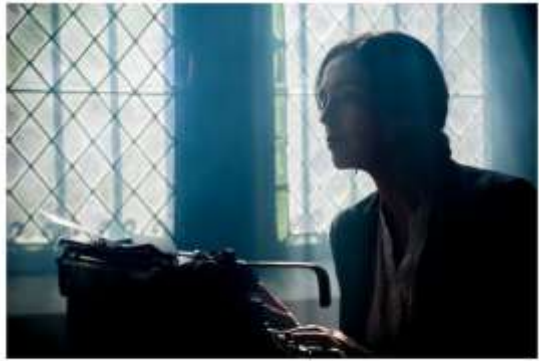
¿Qué está haciendo la mujer?