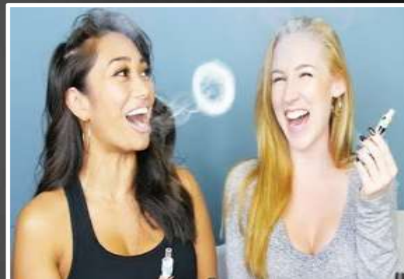
¿Qué están haciendo?