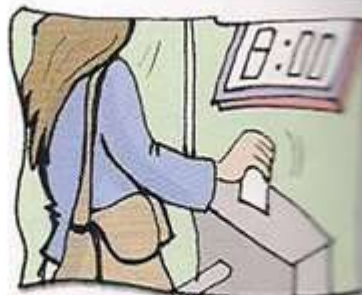
entrar a trabajar