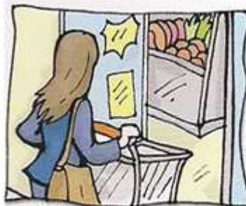
hacer la compra