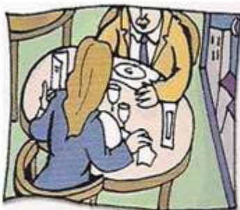
cenar con un cliente