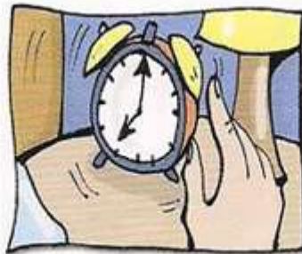
sonar el despertador