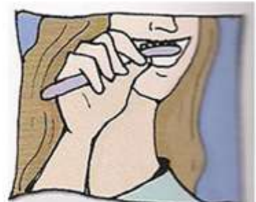
lavarse los dientes