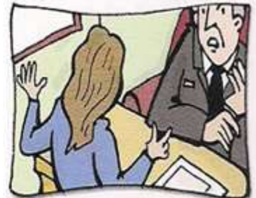
tener una reunión