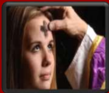
MIÉRCOLES DE CENIZA

La Iglesia Católica Apostólica Romana es la iglesia católica de mayor número de creyentes en el mundo, los cuales están bajo la autoridad del Papa. La Semana Santa, según la tradición de la Iglesia Católica Romana, comienza con el Domingo de Ramos, fecha en que Jesús entra a Jerusalén y es recibido con hojas de palmeras, y termina con el Sábado Santo. La Pascua comienza después del Sábado Santo. Las siguientes son las fechas del calendario gregoriano para el 2016