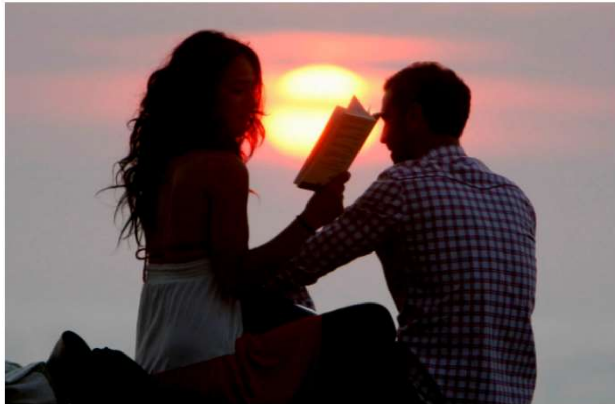
Una pareja lee un libro al atardecer en el Paseo Nuevo de San Sebastián.