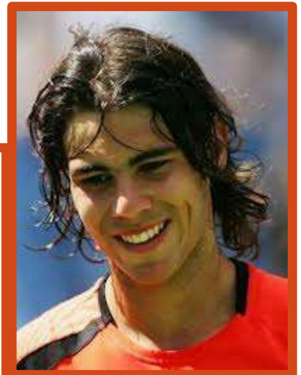
Rafael Nadal (Tenista)