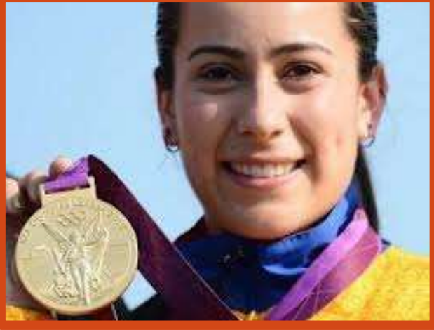
Mariana Pajón (Bicicrocista)