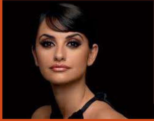
Penélope Cruz (Actriz)